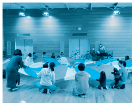
(パラシュート遊び)