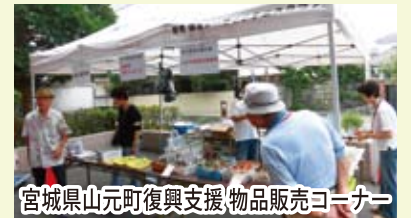
宮城県山元町復興支援物品販売コーナー

昨年度に引き続き山元町復興のために現地の障がい者支援施設(工房地球村)で手作りされた「パウンドケーキ」「いちごジャム」などを販売します。売り上げは全て山元町の復興に役立てられます。