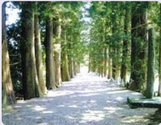
在りし日の杉並木

平成25年4月中旬と5月中旬に南三陸町へアジサイの植栽ボランティアバス事業を実施します。参加者の募集等詳細は、改めて社協のホームページ、鎌倉市広報等でお知らせします。