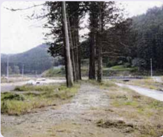
津波による被災後の杉並木