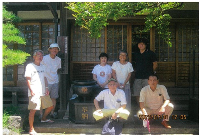
— 役員会を終えて本堂前にて —

現住職のご協力により、年1回の総会 (組長会議) 会場や、まち美化活動の役員集合場所にも利用させて頂いています。